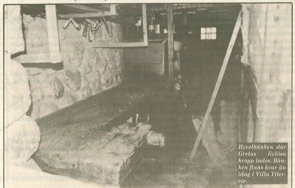
Hyvelbänken där Gretas livlösa kropp lades. Bänken finns kvar än idag i Villa Ytterrör.